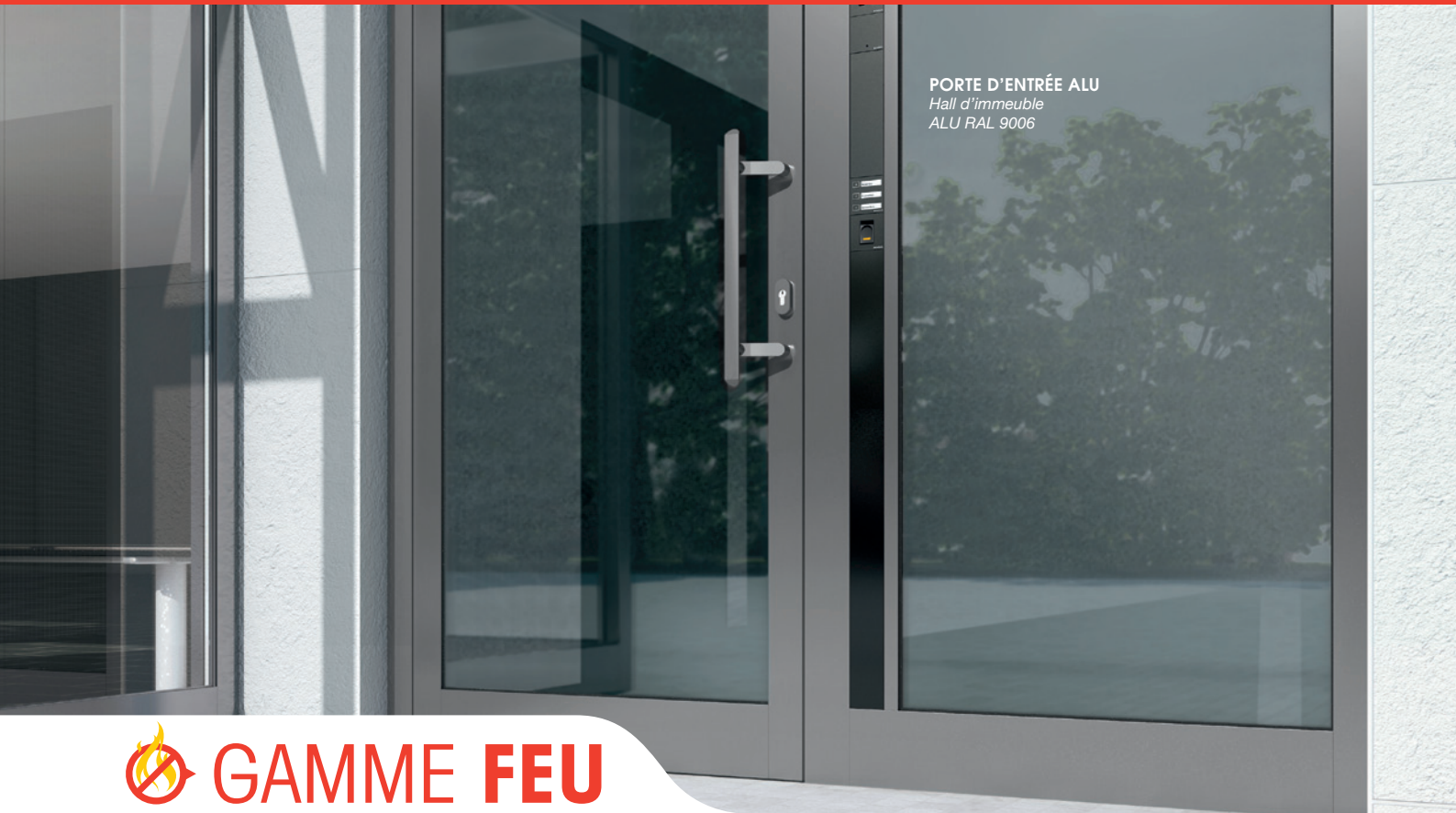
PORTE D'ENTRÉE ALU Hall d'immeuble ALU RAL 9006